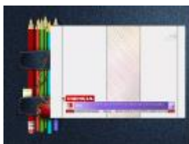
(Слайд №1. Перегляд відеоролика.)